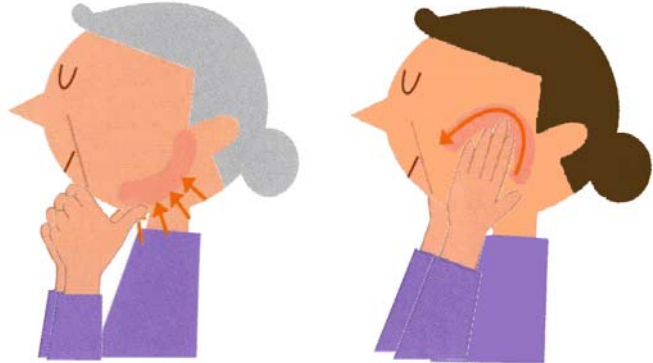
※イラストは歯科関係サイトより