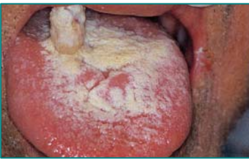
舌苔のこびりついた舌

紹介致します。高齢者の方は、舌の汚れをとらずにいると写真のような「舌苔」がついてしまいますので、汚れが気になった時には使用することを勧めます。「舌ブラシ」は、図のように舌の奥から手前にかき出すように動かします。特に起床時は舌に汚