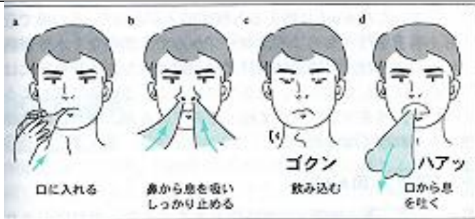
「嚥下障害ポケットマニュアル/聖隷三方原病院嚥下チーム」より引用