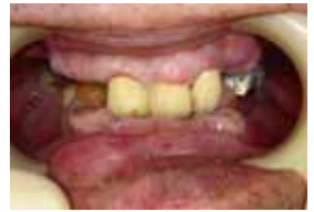
歯周病は歯の欠損など様々な弊害を誘発します。